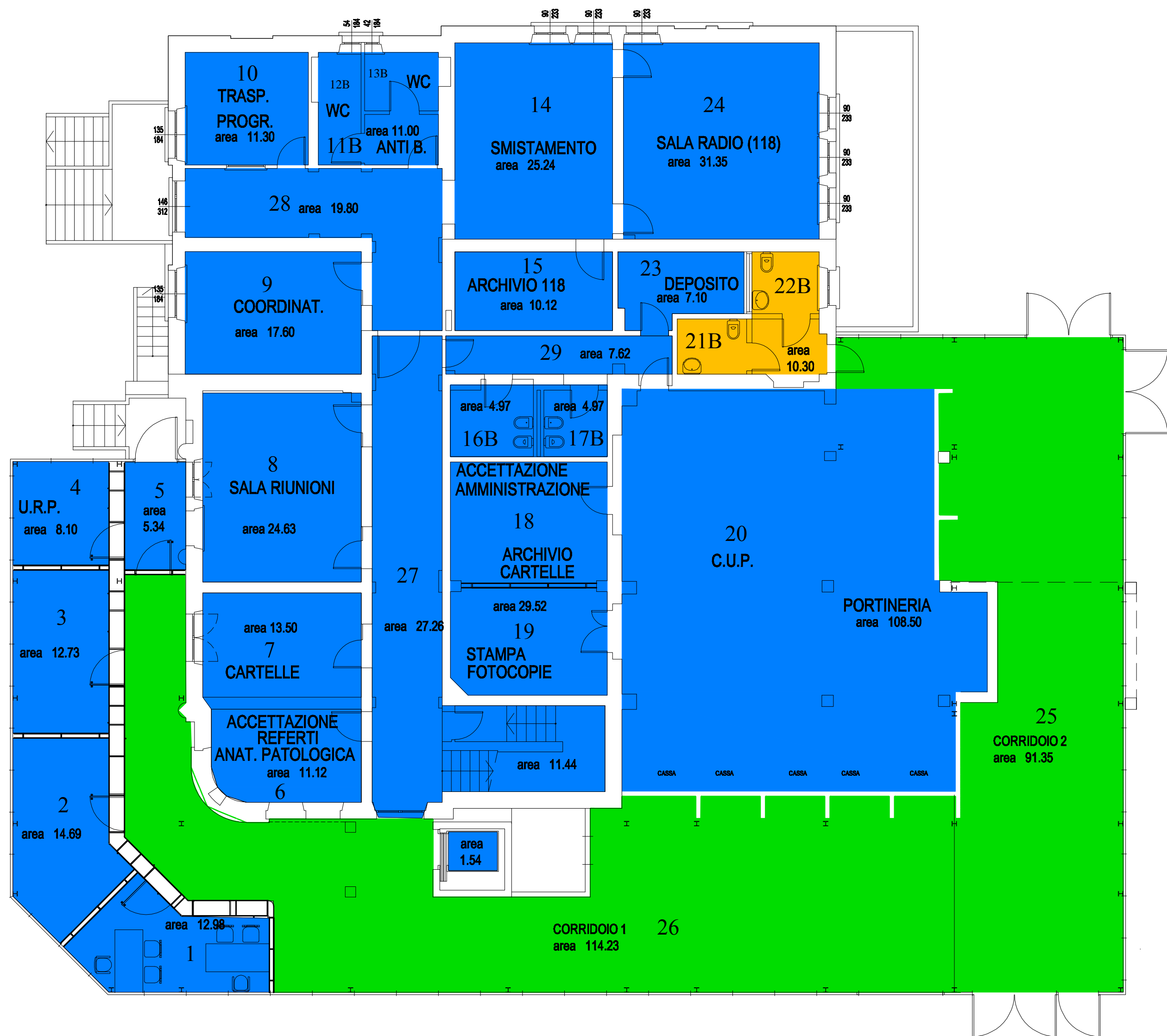
PADIGLIONE "G" - PIANO TERRA